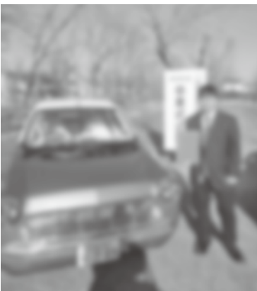
MARCH Eloura スカイミラージュ(白+青) ぼくが色を調合して塗装しました。

おかげさまで、4年間充実した学校生活を送ることができました。いつもご支援くださっている皆様、本当にありがとうございます。