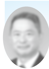
大阪北ロータリークラブ